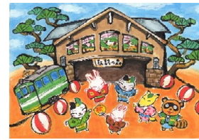
↑長島政彦さん作の CD ジャケット原画と池島さんが描いたイメージ画↓